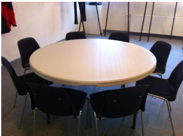
RUNDE KLAPBORDE TIL 8 PERSONER. Ø 153 CM. 20 STK. MAX. I CAFE ØRSTEDET 10 STK. MAX. I TEATERSALEN 17 STK.