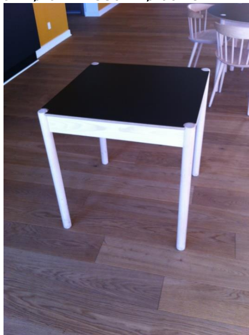
BORDE MED VENDBARE PLADER 5 STK. DIM: 70 X 70 CM.

De 8 runde bordplader i cafe ørstedet kan udskiftes med 8 plader dim. 70 x 70 cm.