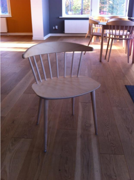
STOLENE KAN IKKE STABLES 80 STK.