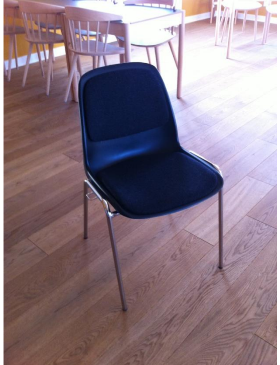
STABELBARE SKALSTOLE m. BETRÆK 250 STK.