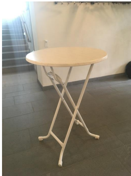
CAFÉBORDE SAMMENKLAPPELIGE 10 STK. Ø 80 CM. H. 110 CM.